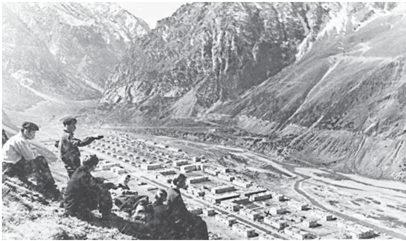
«Здесь будет город заложен». Строительство Тырныауза

рабочей молодёжи. После этого повсеместно стали создаваться комсомольские организации.